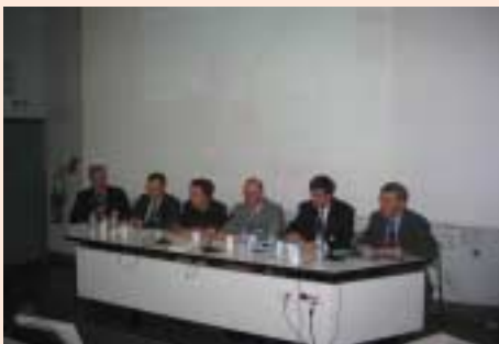
Les intervenants GALIA à NET 2003

GALIA a participé le 1 er avril 2003 à la manifestation de l'AFNET (Association Française du NET) consacrée à la nouvelle économie et plus particulièrement destinée aux PME.